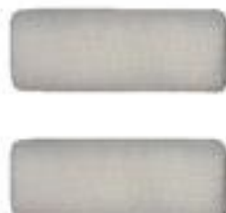
Бинт марлевый не стерильный (5м x 10см)