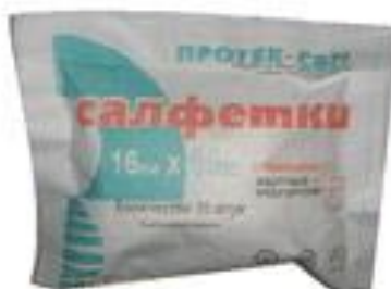
салфетки марлевая медицинская стерильная 16см x 14см.