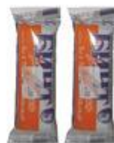
Бинт марлевый стерильный (5м x 10см)