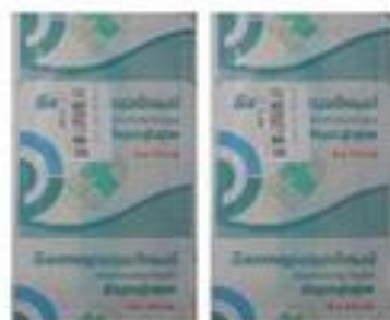
Лейкопластырь бактерицидный (4см x 10см)