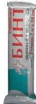
Бинт марлевый стерильный (7м x 14см)