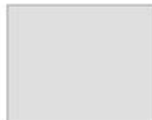
пакет перевязочный стерильный