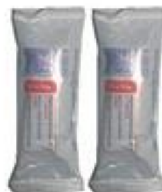
Бинт марлевый не стерильный (5м x 7см)